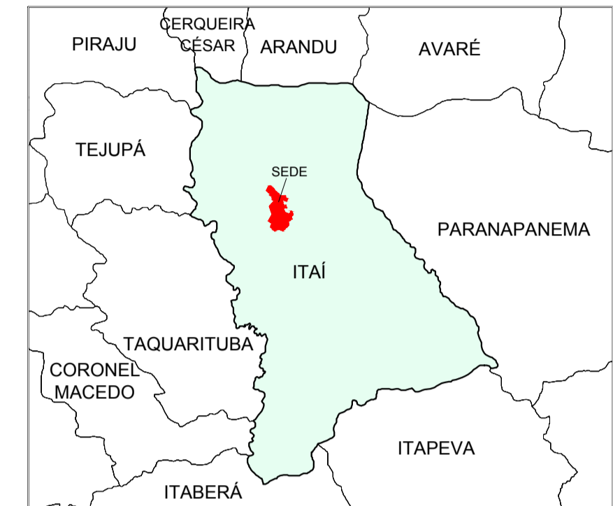
ÁREA DE ESTUDO